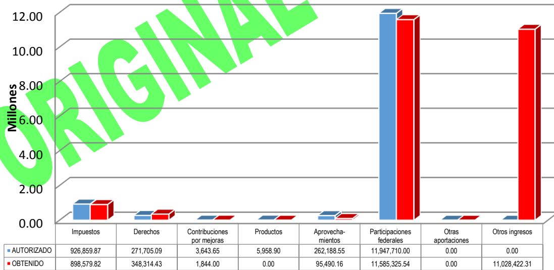
GRÁFICA 1 INGRESOS

Otros ingresos: Otros ingresos $73,392.64, Estímulo fiscal $172,864.15, Remanente de bursatilización $835,781.32, Ingresos por financiamiento (Préstamo FAIS). $9,946,384.20.